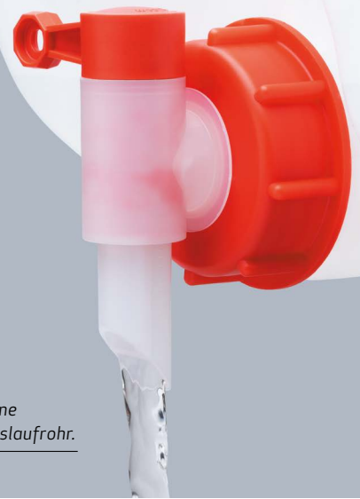
FLUXX ® Ausgießhähne mit 23-Millimeter-Auslaufrohr.

Die FLUXX ® -Ausgießhähne der Eigenmarke erleichtern den Anwendern seit Jahrzehnten das Ab- und Umfüllen von Flüssigkeiten bei einer Vielzahl von Applikationen. Dieses Produktsegment vereint ein Höchstmaß an Dichtigkeit und Funktionalität. Über die Jahre wurde dabei ein breites Produktprogramm entwickelt. Die Ausgießhähne sind für alle gängigen Gewindegrößen unterschiedlicher Behälter wie Flaschen, Kanister, Fässer und IBCs nach DIN 38 bis 71 sowie Kunststoff- und Stahlfässer mit einem 3/4"- bzw. 2"-Gewinde geeignet. Die verschiedenen Produktgrößen sind in zwei Ausführungen erhältlich: mit einem Auslaufrohr von 13 sowie 23 Millimeter Durchmesser. Ausgießhähne mit einem 23-Millimeter-Auslauf ermöglichen das Ab- und