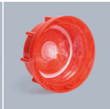
Anwendungsfertiger FLUXX ® Verschluss mit Entgasungsfunktion.