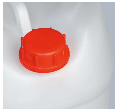
FLUXX ® Verschlussysteme für eine Vielzahl an Behältnissen.

Des Weiteren vervollständigen diverse Verschlussvarianten in den Standardgrößen DIN 45, 50, 51 und 61 das Portfolio, welche auch mit Entlüftungs- und Siegelfunktion verfügbar sind. >>